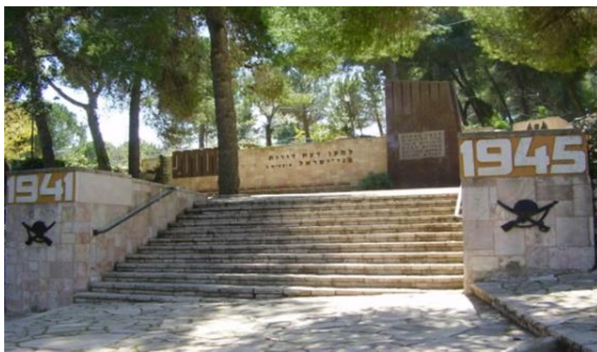
Мемориал 200 000 погибшим воинам-евреям на горе Герцля. Иерусалим